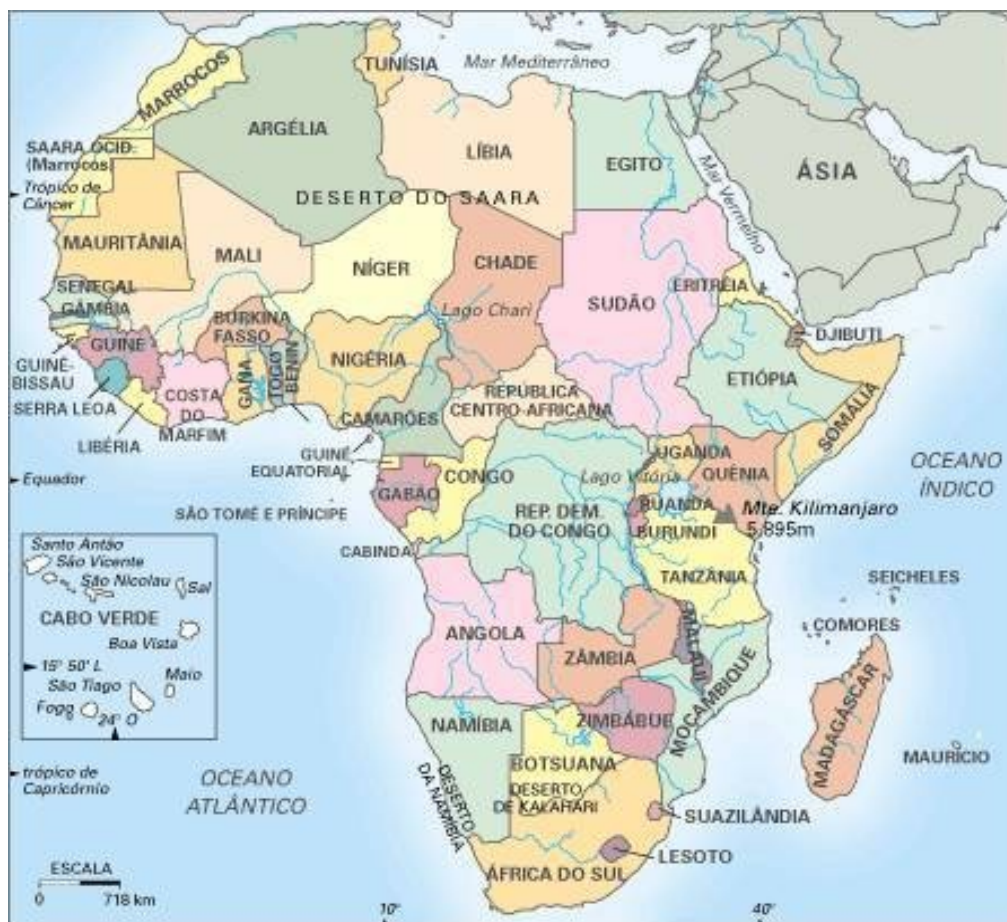
Mapa Político da África - http://www.suapesquisa.com/mapas/mp-africa.jpg

A história da África é importante para nós brasileiros, porque ajuda a explicar-nos e a compreender melhor o grande continente que fica a nossa frente, de onde proveio quase a metade de nossos antepassados. As relações entre o Brasil e a África, nos últimos tempos, têm sido consideradas prioritárias pelo governo brasileiro, estabelecendo um maior intercâmbio com aquele continente. Neste sentido foi criada a UNILAB (Universidade Federal da Integração Luso-Afro-Brasileira) com sede no Ceará, na cidade de Redenção, voltada especialmente para os países lusófonos da África que são: